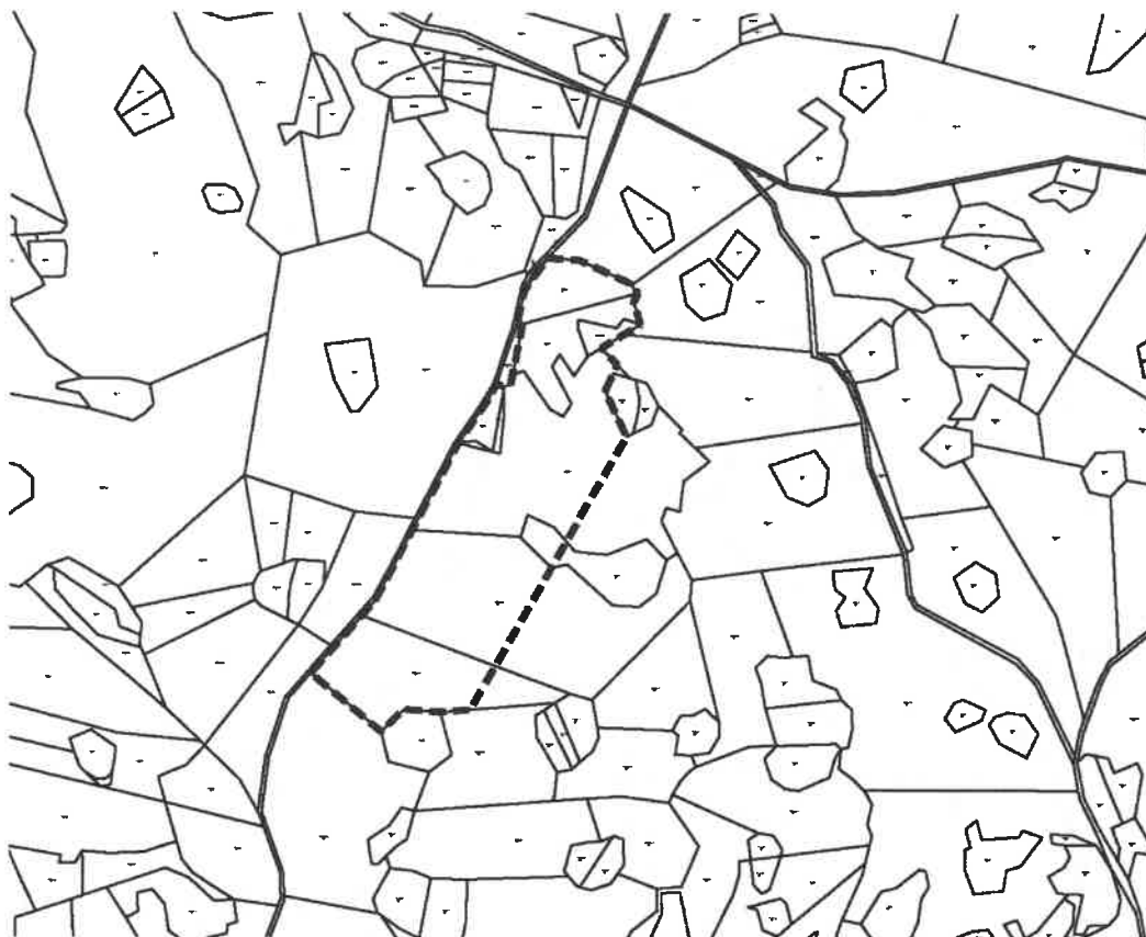
Slika 2.a. Novo građevinsko područje gospodarske namjene izvan naselja – naselje Rudani, (obuhvat prikazan crnom isprekidanom linijom; približna površina iznosi 4 ha)